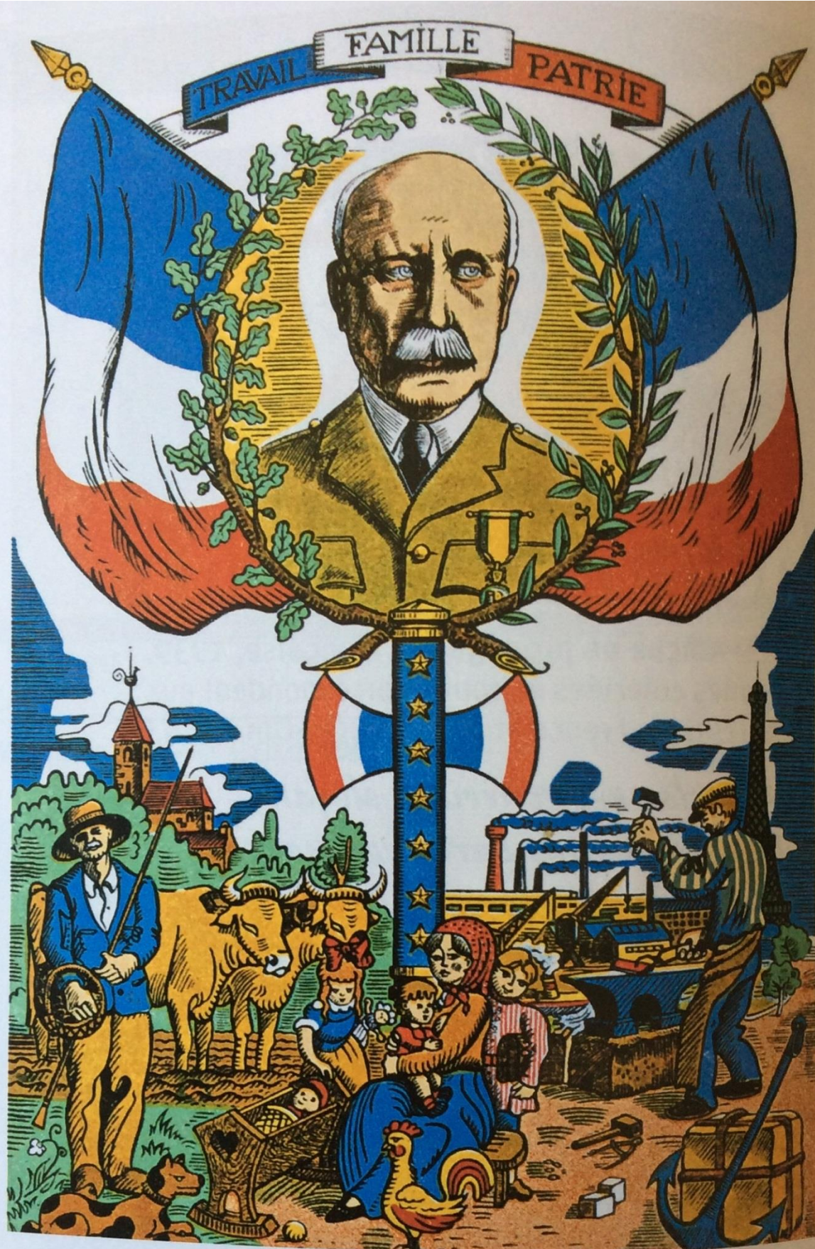
Doc. 2 Affiche de propagande de l'État français en 1940. L'État français est un régime autoritaire. Il est aussi appelé « régime de Vichy », du nom de la capitale où étaient situés les organes de gouvernement entre 1940 et 1944.